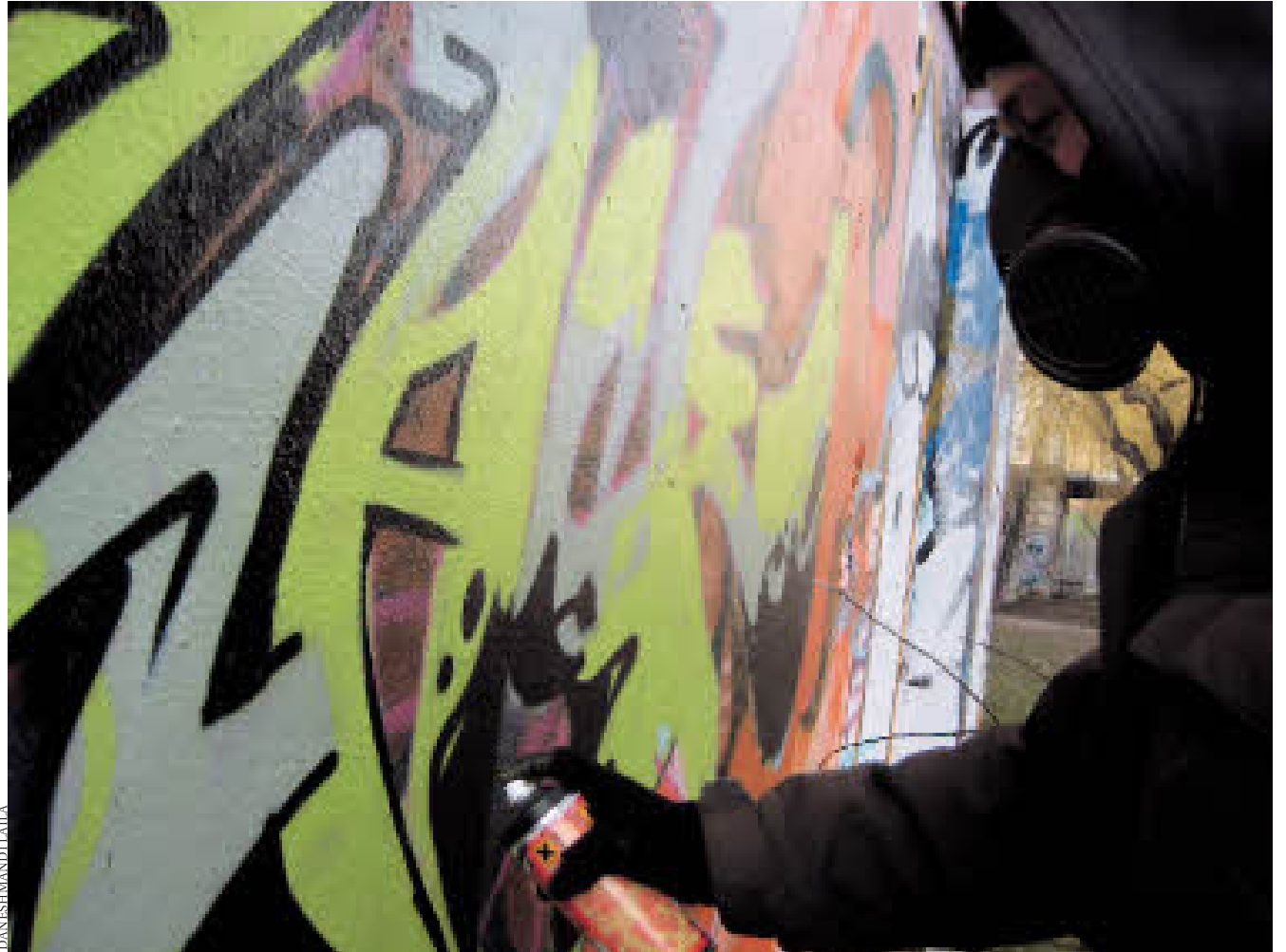
Schnell und möglichst leise: Illegale Sprühaktionen sorgen oft genug für Ärger. In Wien gibt es etliche legale Wände für Graffiti

Ärgernis Wilde Sprühaktionen auf Hauswänden und illegalen Flächen sorgen aber auch oft genug für Ärger. Die Reinigungskosten sind für Private hoch, meist greifen sie einfach zum Farbkübel und übermalen die Schmiererei – bis die nächste kommt. Da Graffiti bei der Polizei allgemein unter Sachbeschädigung geführt werden, sind auch keine genauen Zahlen bekannt.